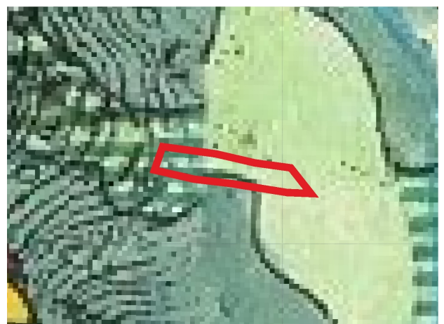
WYRYS ZE STUDIUM UWARUNKOWAŃ I KIERUNKÓW ZAGOSPODAROWANIA PRZESTRZENNEGO MIASTA SZCZAWNICA