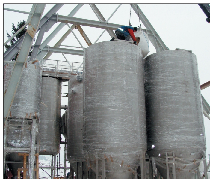
Trwające prace na stacji uzdatniania wody