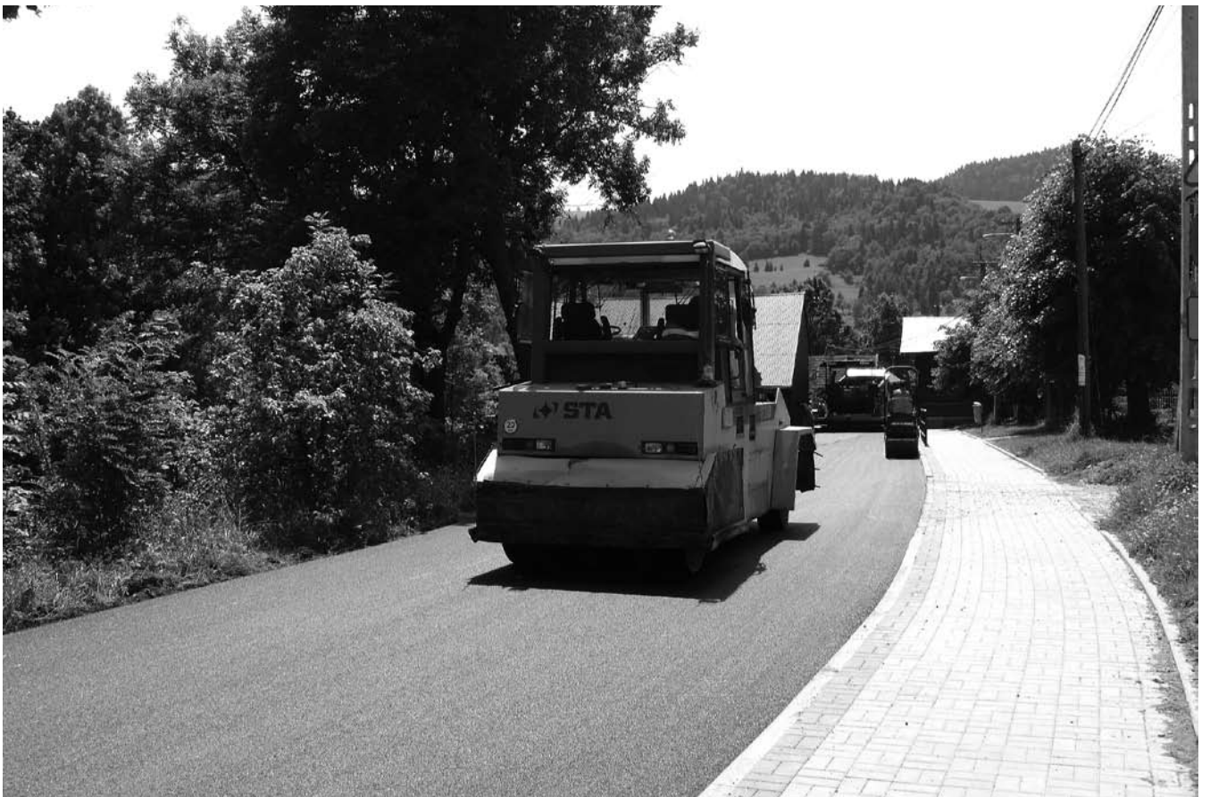
Na ulicy Jana Pawła II w Szlachtowej trwają prace związane z wykonaniem nowej nawierzchni asfaltowej na odcinku 850 mb oraz dalszej części chodnika.