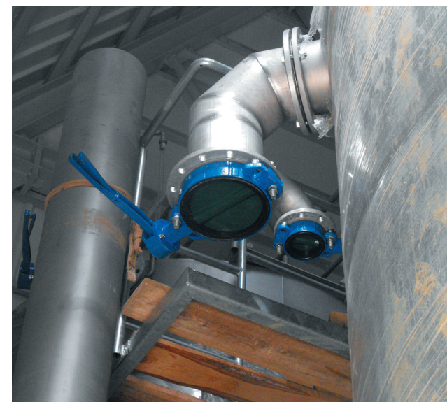
Montowane przepustnice do sterowania przepływem