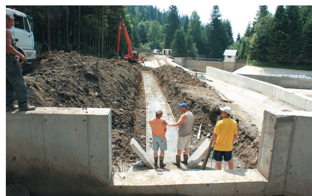
Trwające prace na ujęciu wody pokrzywy